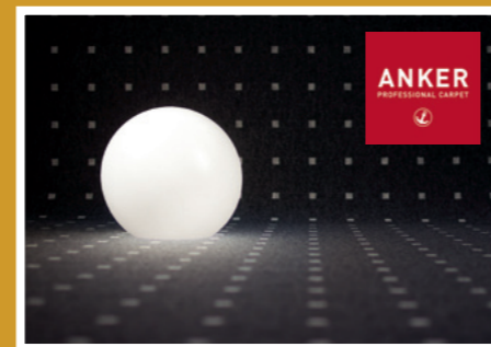
Eine große Auswahl: Lassen Sie sich inspirieren! ANKER ist eine eingetragene Marke der ANKER Gebr. Schoeller GmbH + Co. KG, Düren.

Unter diesem Begriff präsentiert das Tra- ditionshaus Anker seine neue Objekt- kollektion für robuste Teppichböden. Die verschiedenen Designs sind in fünf Ord- nern zu einem Würfel zusammengefasst. Bemerkenswert ist das zu 100 % recycelte Econyl-Garn. Es ist nicht wie üblich ein- gefärbt, sondern durchgefärbt. Das hat große Vorteile in der Reinigungsfähigkeit, UV- und Farbstabilität aber auch in der Ökobilanz.