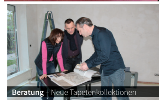
Beratung – Neue Tapetenkollektionen