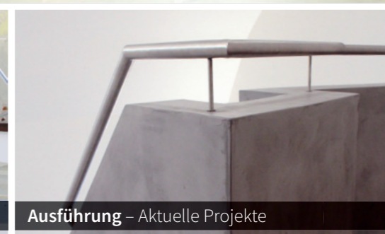
Ausführung – Aktuelle Projekte