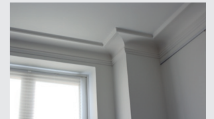
Gespachtelte Wände mit Glattvlies beklebt, Wandfarbe Nassabriebsklasse 1, Farbton 3D Hellweiß. Wandabschluss zur Decke mit Orac Stuckprofil Heritage XL.