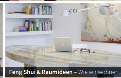
Feng Shui & Raumideen – Wie wir wohnen...