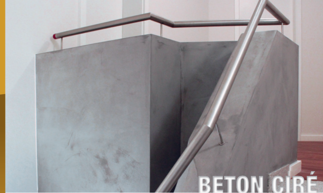
CPW Cramer Paris Werkstoffe

Neu in unserem Hausprogramm sind die Kollektionen Essener Selena und Spect- rum sowie die Rasch Textil Raffinesse und Tintura.