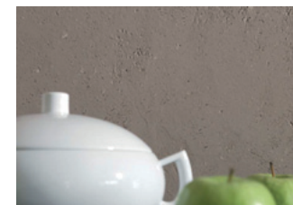
Art Nobile Terra 304