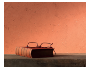
Art Nobile Apricot 203

Seit längerer Zeit besteht der Trend zum natürlichen Wohnen, der durch Nachhaltigkeit der Baustoffe und handwerkliche Individualität bei der Verarbeitung überzeugt und sich so von dem Gros der handelsüblichen Standards abhebt. Neben Tapeten als Wandverkleidung wird auch der Innenputz immer öfter als Alternative herangezogen. Die Vorteile liegen auf der Hand: >> Lesen Sie weiter in dem Innenteil